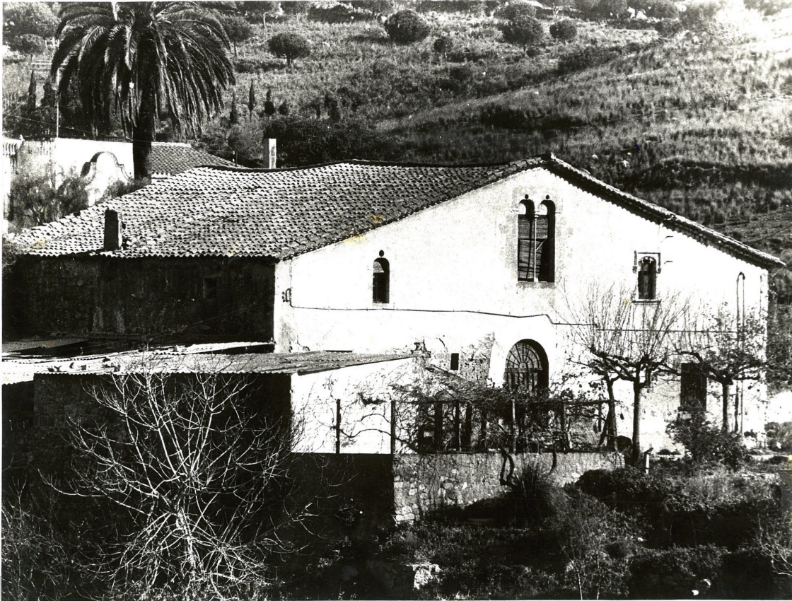
Can Gaietà de Tiana